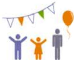
Organisation de la fête de l'école et activités festives