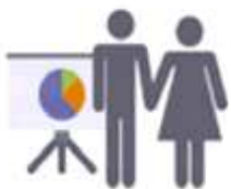
Formation des équipes Apel