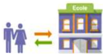
Organisation de Rencontres parents-école @