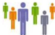
Organisation de conférences-débats sur des sujets éducatifs