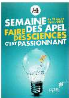
La Semaine des Apel pour créer une dynamique, renforcer les liens parents, enfants et enseignants et organiser un événement qui vous ressemble